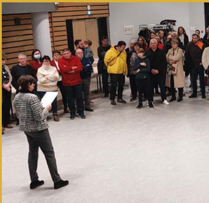
17 janvier > Vœux du maire