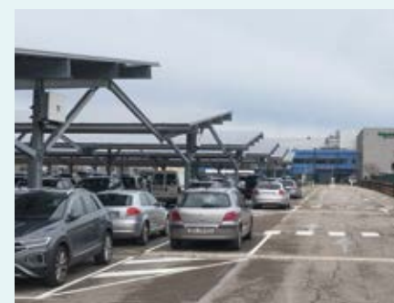
PARKING SOLAIRE SEA