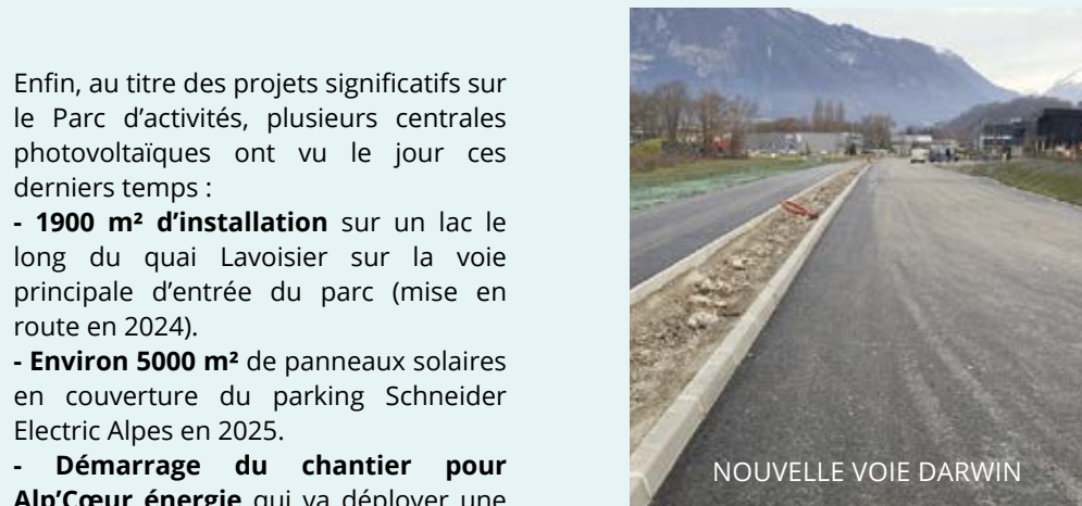
NOUVELLE VOIE DARWIN