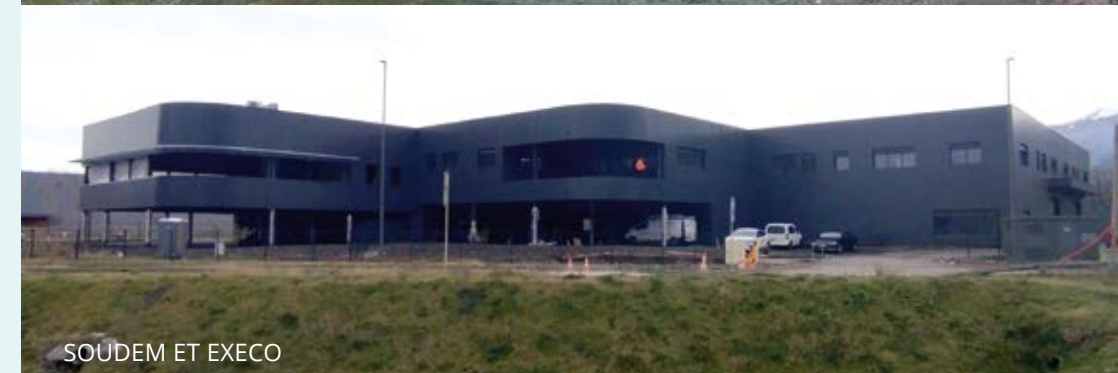
SOUEM ET EXECO