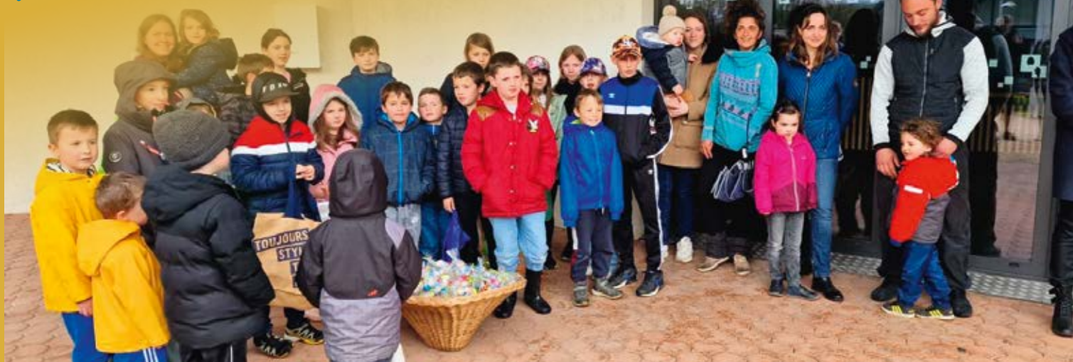
Œufs de paques