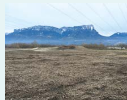
TERRAIN ALP'CŒUR ÉNERGIE