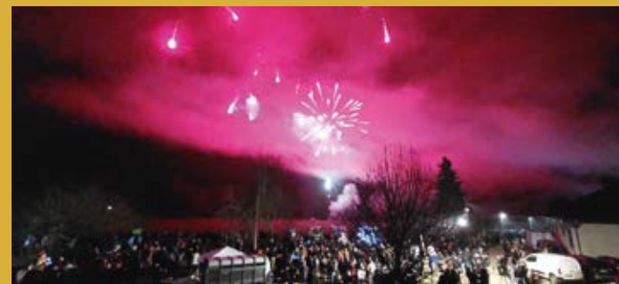
13 décembre > Marché de Noël