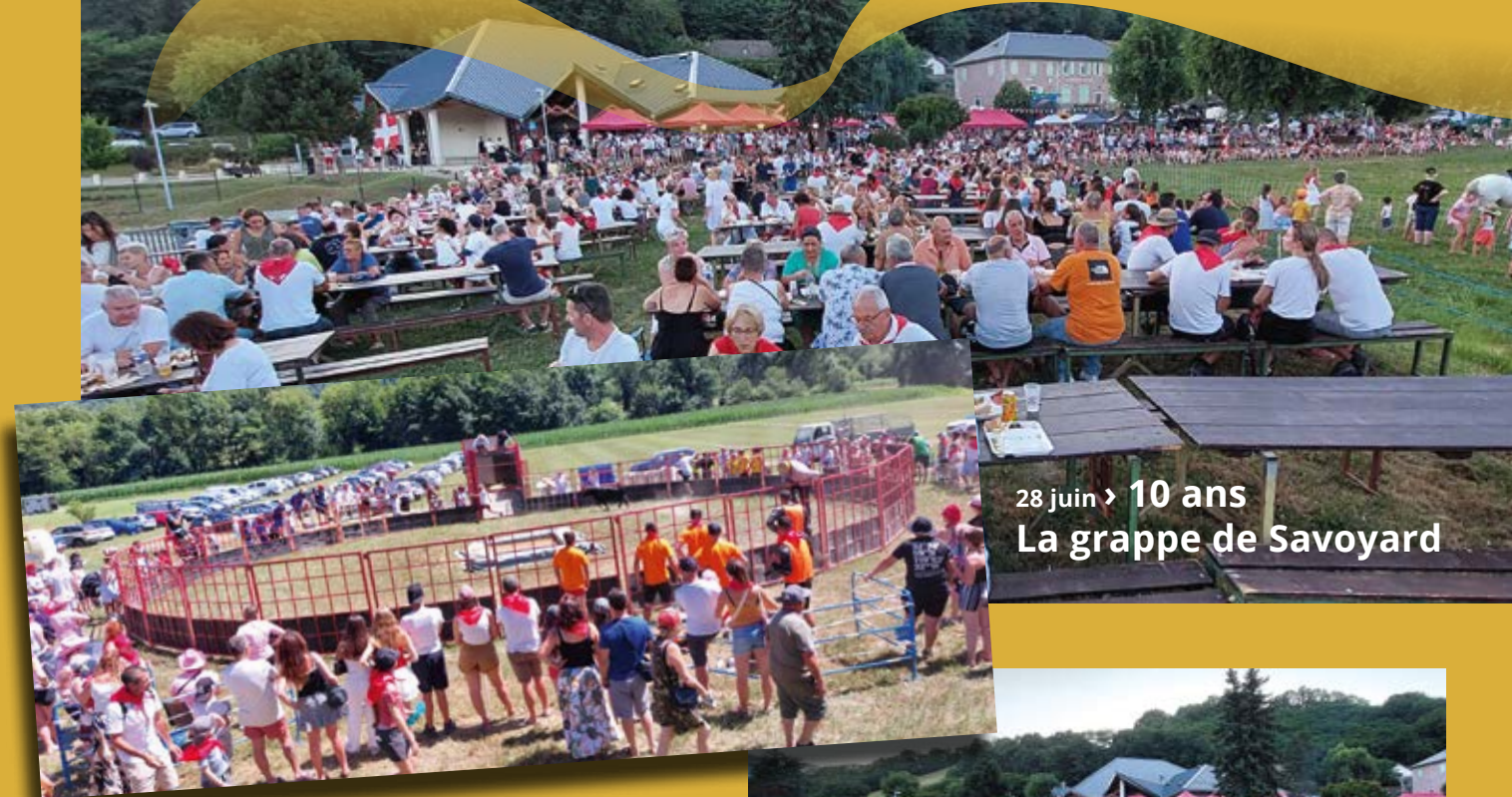
28 juin > 10 ans La grappe de Savoyard