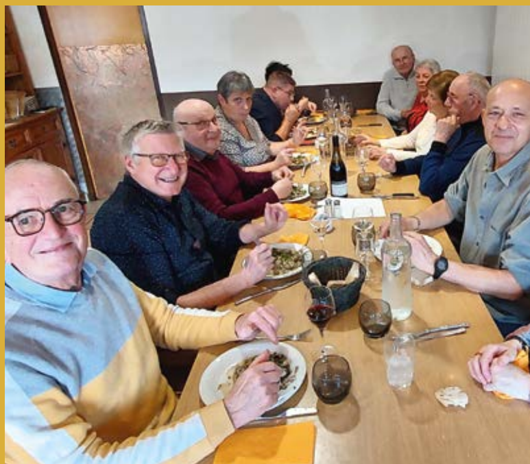
25 janvier > Repas des aînés