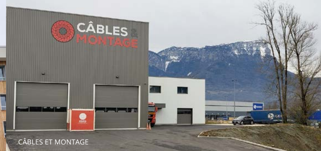
CÂBLES ET MONTAGE