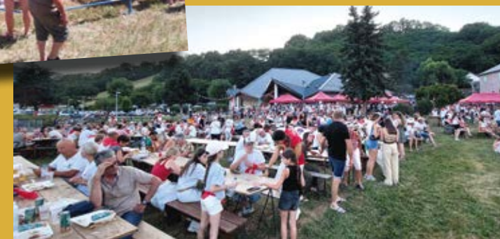
23 août > Vogue